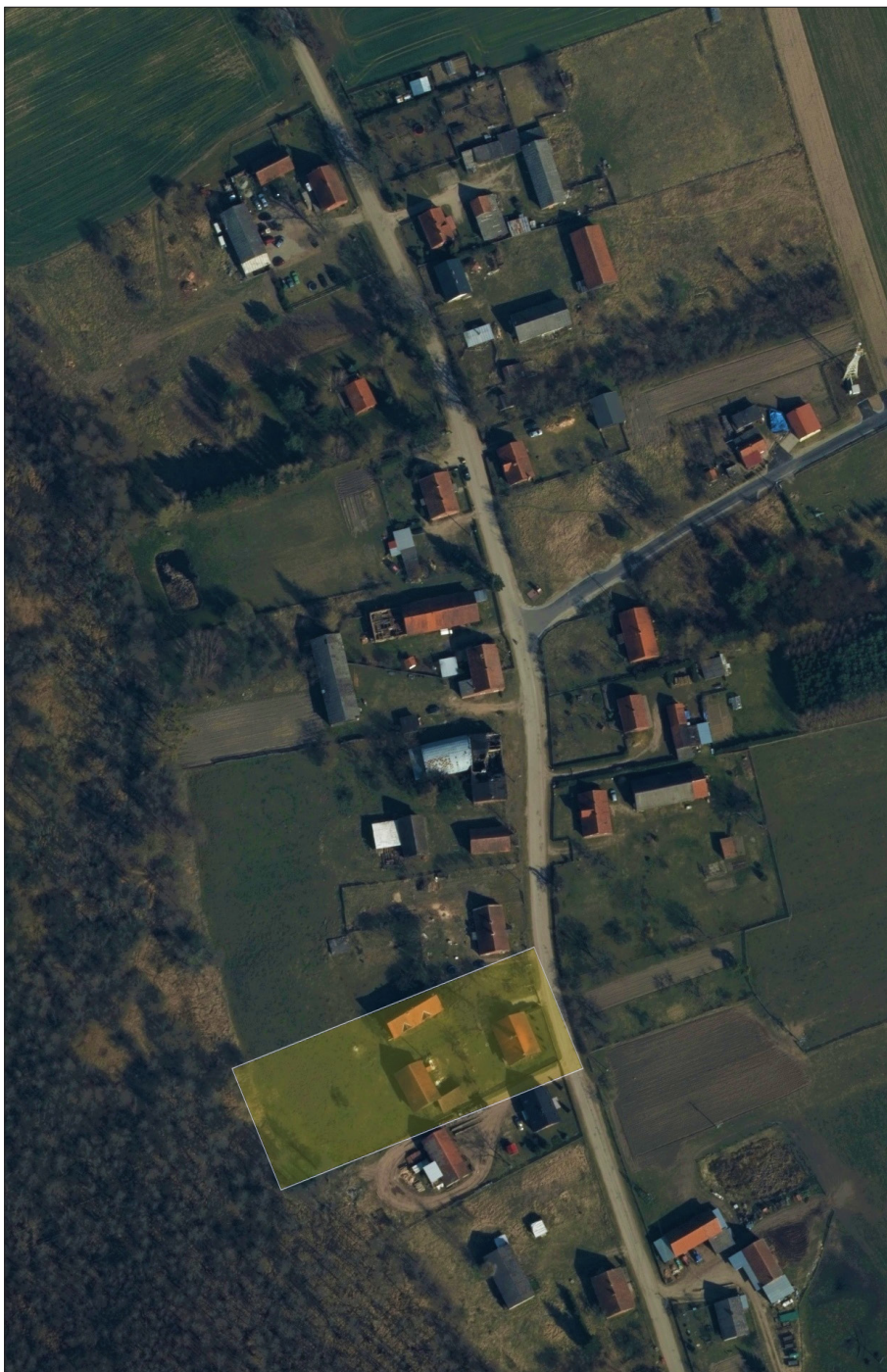
3. Obszar dawnej leśniczówki w Mortągu, stan z roku 2021, Geoportal 2