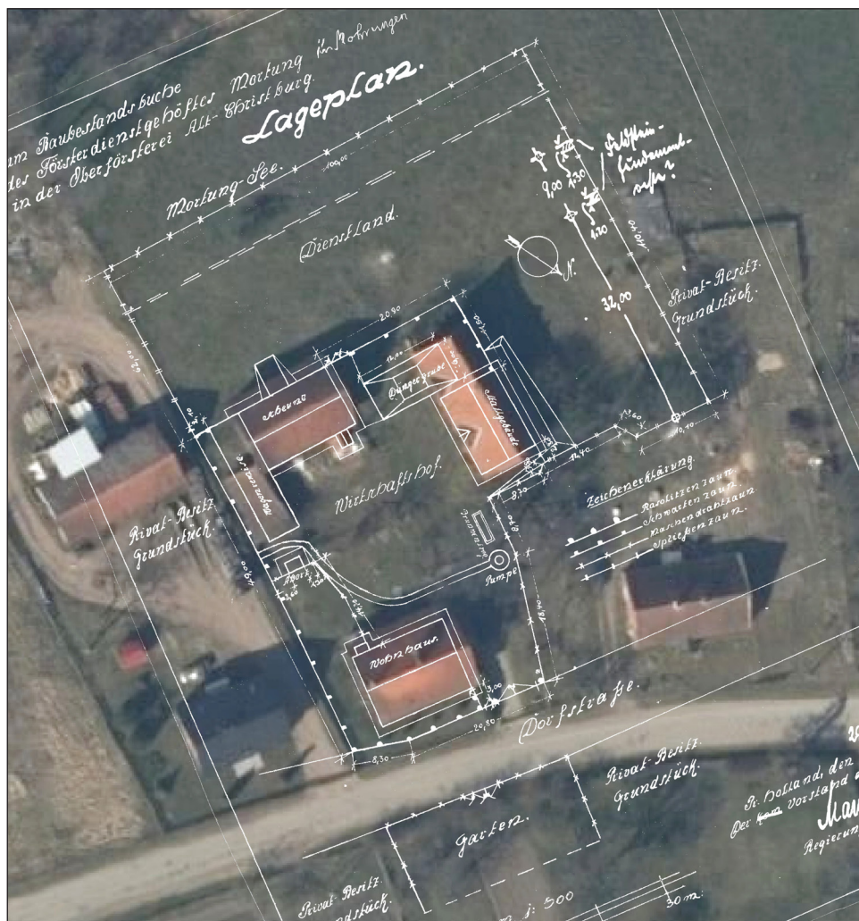
1b. Plan leśniczówki w Mortągu z 1929 r. przedstawiony na podkładzie ortofotomapy z roku 2021 (opr. Leszek Sufranek)

należał zapewne do leśniczówki, gdyż działki obok opisano jako własność prywatną ( Privat-Besitz ). Prawdopodobnie jest to wymieniony przez Boettichera ogród, na obszarze którego odkryto relikty piwnic z ozdobioną barwnymi kaflami posadzką i dalszymi ruinami w jego przedłużeniu. Poparciem takiego domniemania jest obecność osuszonego jeziora na południe od tego ogrodu, o czym informuje także Boetticher. Obecnie jest to obszar częściowo użytkowany.