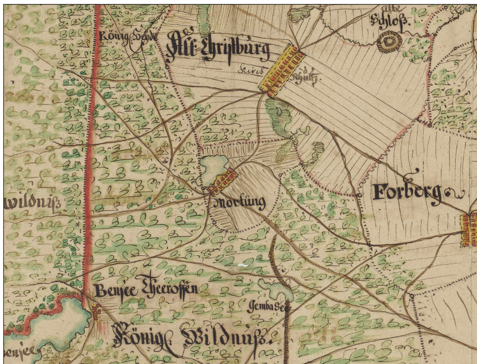
2. Mortąg i okolice wg planu S. v. Suchodolca z 1705 r. GStA PK, XX HA, D 10031

Budynek leśniczówki i zabudowania gospodarcze zachowały się do naszych czasów. Obecnie są własnością prywatną (fot. 3). W ich sąsiedztwie kilka lat temu (2009 r.), podczas prac remontowych w pobliskim budynku znaleziono cegły gotyckie (fot. 4), które pochodzić mogły z wcześniejszej rozbiórki zachowanych relikwów dworu i jego przyległości 56 . Mając na uwadze odkryte w 1934 r. fundamenty oraz informacje Adolfa Boettichera o relikwach piwnic w ogrodzie leśniczówki, domniemywać możemy, że mamy w obu przypadkach do czynienia z większym kompleksem zabudowań gotyckich, znajdujących się na kilkudziesięciometrowym obszarze wokół dawnej leśniczówki w Mortągu, a które stanowią elementy znanego ze źródeł XIV i XV w. dworu oraz folwarku krzyżackiego. Aby potwierdzić lub wykluczyć niniejszą tezę autorów w szczególności pomocne okazać się mogą badania archeologiczne.