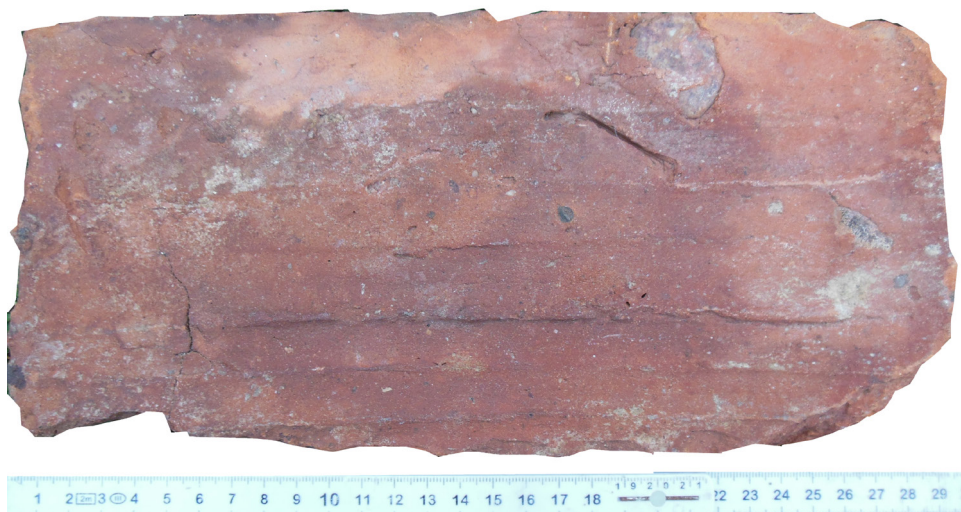
4. Cegła gotycka znaleziona wspólnie w Mortągu w okolicy dawnej leśniczówki